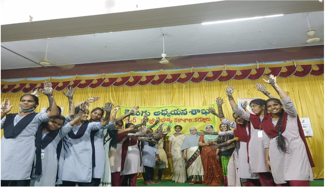
Students Showcasing the Mehendi Designs