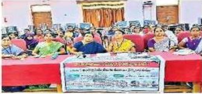
సదస్సులో పాల్గొన్న అధ్యాపకులు, విద్యార్థినులు